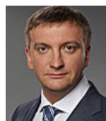
Міністр юстиції України ПЕТРЕНКО Павло Дмитрович

Реформування системи пільг з метою забезпечення адресності їх надання. Збільшення кількості одержувачів субсидій до 3-4 мільйонів сімей. Розширення кола надавачів соціальних послуг за рахунок залучення недержавних організацій. Підготовка до проведення пенсійної реформи, зокрема шляхом запровадження професійної пенсійної системи та створення умов для запровадження накопичувальної системи. Модернізація служби зайнятості та сервісу надання послуг шукачам роботи та роботодавцям. Затвердження та реалізація Програми працевлаштування та професійного навчання внутрішньо переміщених осіб на 2015-2016 роки.