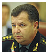
Міністр оборони України ПОЛТОРАК Степан Тимофійович за поданням Президента України

Проведення відкритого публічного конкурсу на посаду директора ДП «Палац спорту». Продовження повернення до державної власності спортивних об'єктів та іншого майна, відчуженого у корупційний спосіб за режиму Януковича.