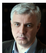
Міністр освіти і науки України КВИТ Сергій Миронович від фракції партії «Блок Петра Порошенка»

Проведення реорганізації ЗСУ, їх кадрове та технічне забезпечення, у тому числі оптимізація системи освіти військових.