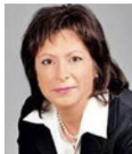
Міністр фінансів України ЯРЕСЬКО Наталія Енн

Створення сприятливого інвестиційного клімату для розвитку територій шляхом розроблення містобудівної документації. Планується поступове приведення тарифів до економічно обґрунтованих. Підвищення енергоефективності, енергоощадності та розвиток альтернативної енергетики в житлово-комунальній сфері.