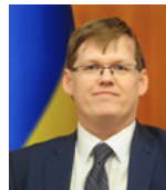
Міністр соціальної політики України РОЗЕНКО Павло Валерійович

Українська система стандартизації та технічного регулювання приводиться до європейських стандартів, що значно спростить експорт наших товарів на ринки ЄС. Ми розпочали реформування системи державних закупівель, аби зробити їх чесними та конкурентними.