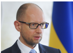
Прем'єр-міністр України ЯЦЕНЮК Арсеній Петрович

Уряд взяв на себе політичну відповідальність за стан справ у країні і пішов на ті кроки, які не робилися понад 20 років. Це наша місія, наше завдання, і ми це робимо.