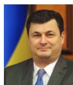
Міністр охорони здоров'я України КВИТАШВІЛІ Олександр від фракції партії «Блок Петра Порошенка»

Реформування дошкільної, середньої, професійно-технічної, позашкільної освіти згідно з європейськими стандартами. Зокрема, підготовка та подання на розгляд Парламенту проектів законів «Про внесення змін до деяких законодавчих актів України щодо професійно-технічної освіти», «Про науку і науково-технічну діяльність», а також «Про освіту».