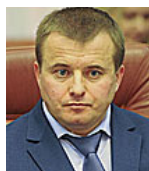
Міністр енергетики та вугільної промисловості України ДЕМЧИШИН Володимир Васильович від фракції партії «Блок Петра Порошенка»

Переведення максимальної кількості адміністративних послуг в онлайн-режим, створення реальної системи «єдиного вікна» та перехід на електронні процедури у відносинах з бізнесом, автоматизація контролю. Максимальна прозорість діяльності Мінприроди – публічність витрат бюджетних коштів, відкритий реєстр чиновників із зазначенням розмірів зарплат та надбавок, онлайн-реєстр виданих дозволів та ліцензій. Перетворення Чорнобильської зони на біосферний заповідник та повернення безпечних територій до нормального життя та економічної активності. Докорінне реформування системи екологічного контролю.