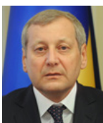
Віце-прем'єр-міністр України ВОЩЕВСЬКИЙ Валерій Миколайович від фракції Радикальної партії Олега Ляшка

Хочу попросити тільки одного – витримки, розуміння і єдності. Давайте думати не про себе, а про наших дітей і майбутні покоління. Про те, як витягнути країну з цієї прірви. Іншого рецепту не існує.