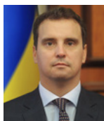
Міністр економічного розвитку і торгівлі України АБРОМАВИЧУС Айварас

Зменшення дефіциту державного бюджету. Проведення консультацій з тримачами суверенного боргу країни з метою зменшення боргового навантаження на держбюджет у найближчі роки. Створення умов для того, аби Україна знову могла повернутися на зовнішні ринки. Вдосконалення податкового законодавства: поліпшення як податкової політики, так і самого процесу адміністрування податків. Реформування роботи Міністерства фінансів, яке має стати справжнім європейським міністерством за стандартами та якістю своєї роботи.