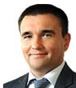
Міністр закордонних справ України КЛІМКІН Павло Анатолійович за поданням Президента України

Тривають перемовини з Китаєм та низкою інших держав щодо залучення коштів для модернізації інфраструктури ПЕК, що дасть можливість забезпечити нові робочі місця, зменшити втрати енергії на етапі виробництва та донесення до споживача.