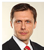
Міністр екології та природних ресурсів України ШЕВЧЕНКО Ігор Анатолійович від фракції політичної партії Всеукраїнське об'єднання «Батьківщина»

Збільшення експорту сільськогосподарської продукції та відкриття і подальше розширення світових ринків. Зокрема відкриття ринків ЄС для молочної та м'ясної продукції. Переговори з ЄС щодо збільшення квот на деякі види сільгосппродукції. Адаптація чинного законодавства відповідно до вимог ЄС.