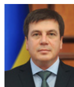
Віце-прем'єр-міністр – Міністр регіонального розвитку, будівництва та ЖКГ України ЗУБКО Геннадій Григорович від фракції партії «Блок Петра Порошенка»

Реформа пам'яткоохоронного законодавства з метою його децентралізації та дерегуляції.